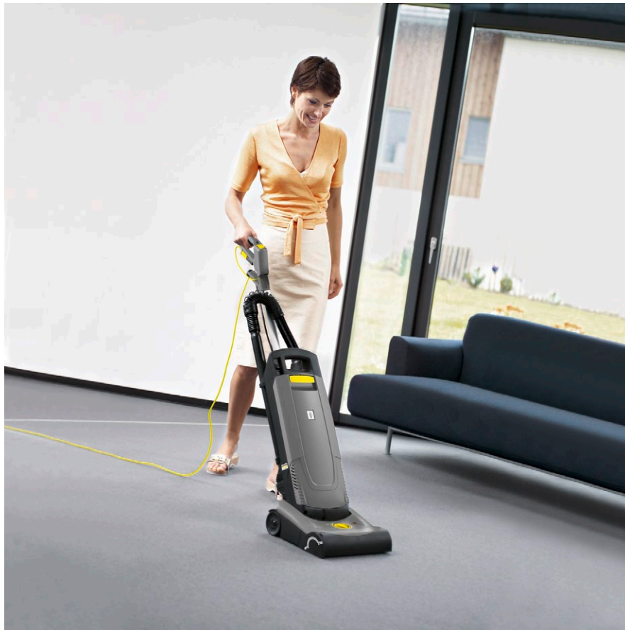
Пылесос CV 30/1